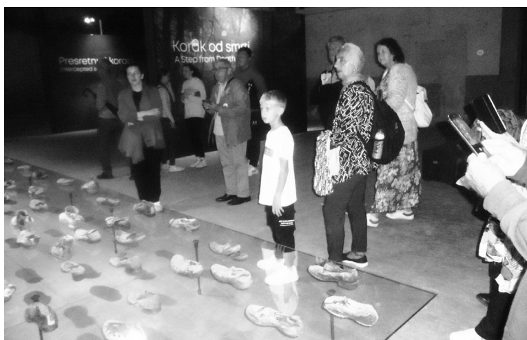
IZ BOGATE AUDIO, VIDEO I DOKUMENTACIJSKE ZBIRKE MUZEJA - INSTALACIJA „KORACIMA KOJI (NI)SU PROŠLI“, NA 8 M DUGOJ STAKLENOJ PODLOZI, JE OBUĆA SREBRENIČKIH NESRETNIKA. NA PODU SU NASLIKANE STOPE, A SA STROPA VISE TRAKE S PISANIM PORUKAMA.