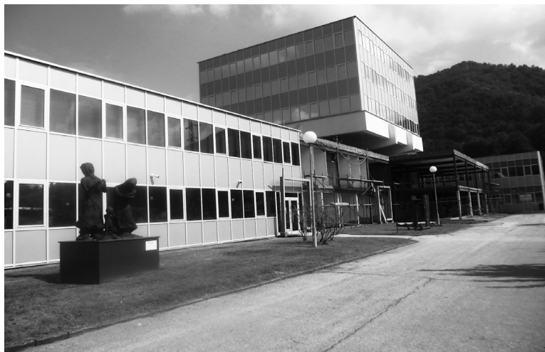
UREĐENJE CENTRALE MEMORIJALA