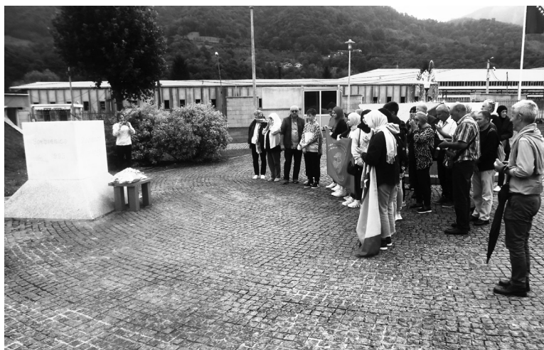
OBVEZA UČENIKA 9. RAZREDA OŠ-A I 2. RAZREDA SREDNJIH U BIH JE POSJET POTOČARIMA I MUZEJU SREBRENICE